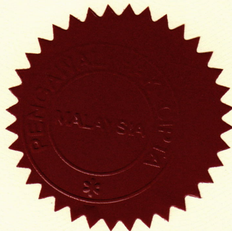
..... DATO' MOHD ROSLAN MAHAYUDIN PENGAWAL HAK CIPTA MALAYSIA

Pada menjalankan kuasa yang telah diberikan kepada saya di bawah Akta Hak Cipta 1987 (Akta 332) dan Peraturan-Peraturan Hak Cipta (Badan Pelesenan) 2012, dengan ini MACP Bhd mempunyai hak-hak [merujuk kepada LAMPIRAN ] untuk mentadbir urus bagi pihak ahli-ahlinya yang merangkumi Penulis Lirik, Komposer dan Penerbit dalam kluster Muzik .